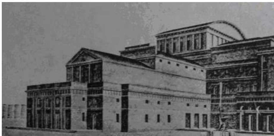
Ryc. 3. Fasada Teatru Miejskiego. Wejście do Teatru „kameralnego” pierwotnie planowano od strony ul. J. Kilińskiego. Brak zgody i naruszenie terenu cerkwi św. Aleksandra, wymusiły na architekcie przeniesienie Teatru „kameralnego” od ul. Skwerowej, proj. C. Przybylski, 1924 r., „Architektura i Budownictwo”, 1936, R. 12, nr 8-9-10 (numer specjalny).